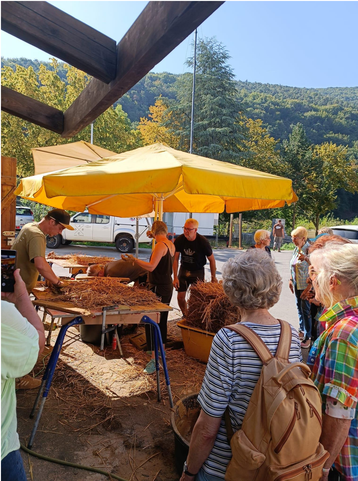
Bei schönstem Wetter zog der Kurs großes Interesse bei Wanderern auf sich